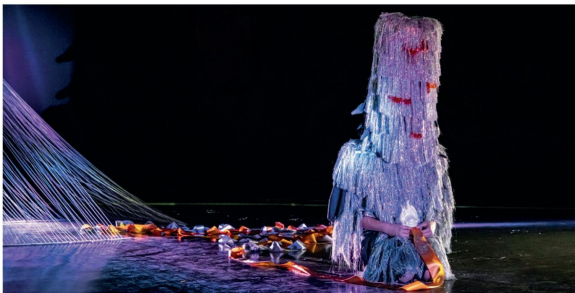
Ngog Lituba, La montagne tombée du ciel

Lors de sessions animées mêlant écoute, lectures de contes, de mythes et de textes sur la force de gestes collectifs, le public est amené à réfléchir à l'engagement solidaire et à retrouver l'espoir dans la transformation sociale. La résidence se clôt par une performance dansée qui unifie ces symboles, incarnant le passage de l'intention individuelle à l'action collective.