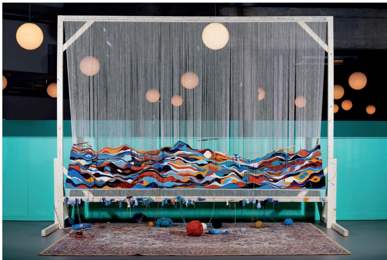
Œuvre collaborative en cours de création dans l'Atelier du Musée en 2025 lors de la première édition de la résidence d'artiste

Exposition et résidence au Musée international de la Croix-Rouge et du Croissant-Rouge en collaboration avec la Croix-Rouge genevoise, le Comité international de la Croix-Rouge (CICR), la Haute école d'art et de design de Genève (HEAD – Genève) et la Fondation AHEAD.