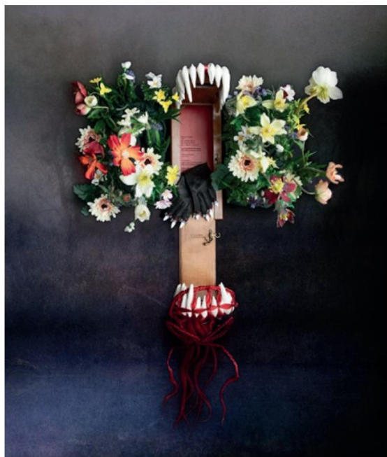
Il était une fois

Le projet Ouvrir la voie invite le public à réinventer des contes traditionnels en incarnant des personnages féministes, transformant ainsi des récits limitants en espaces de créativité et de réflexion collective.